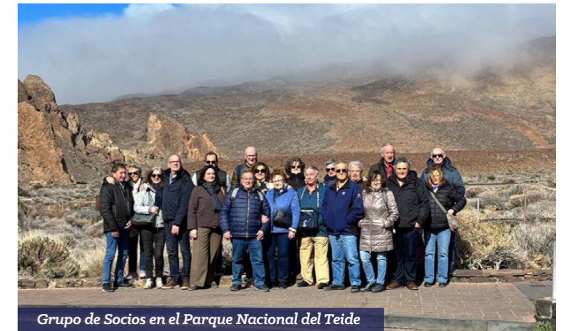
Grupo de Socios en el Parque Nacional del Teide

A pesar de que la temperatura no acompañó durante esa semana de enero, los socios aprovecharon para desconectar, disfrutar de la gastronomía tinerfeña y los encantos de la isla.