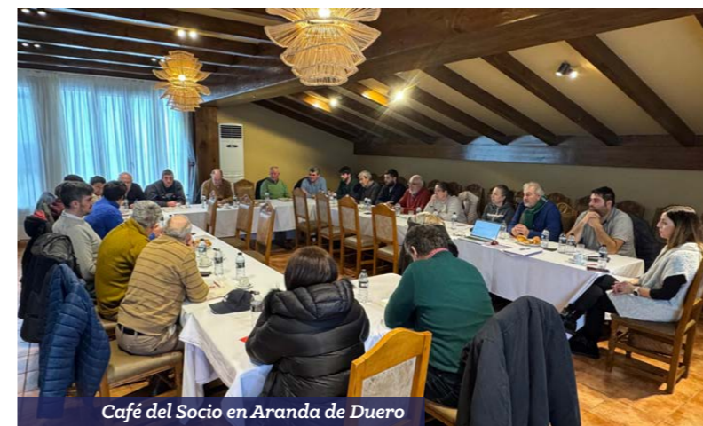
Café del Socio en Aranda de Duero