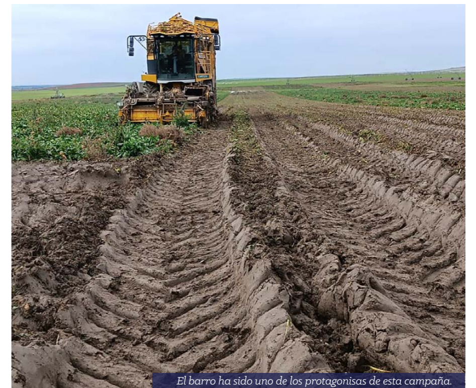
El barro ha sido uno de los protagonistas de esta campaña.

El Servicio Agronómico divulgó en primavera un itinerario de tratamientos insecticidas para poner el foco en la estrategia de control durante estos meses. En dicho itinerario se recomendó aplicar los tratamientos insecticidas alternativos y permitidos por la administración, que sirven de referencia a nuestros socios para el control de dichas plagas.