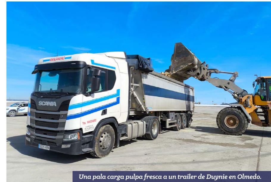
Una pala carga pulpa fresca a un trailer de Duynie en Olmedo.

Duynie, el mayor procesador de coproductos de Europa, comercializa toda la producción de pulpa prensada de ACOR