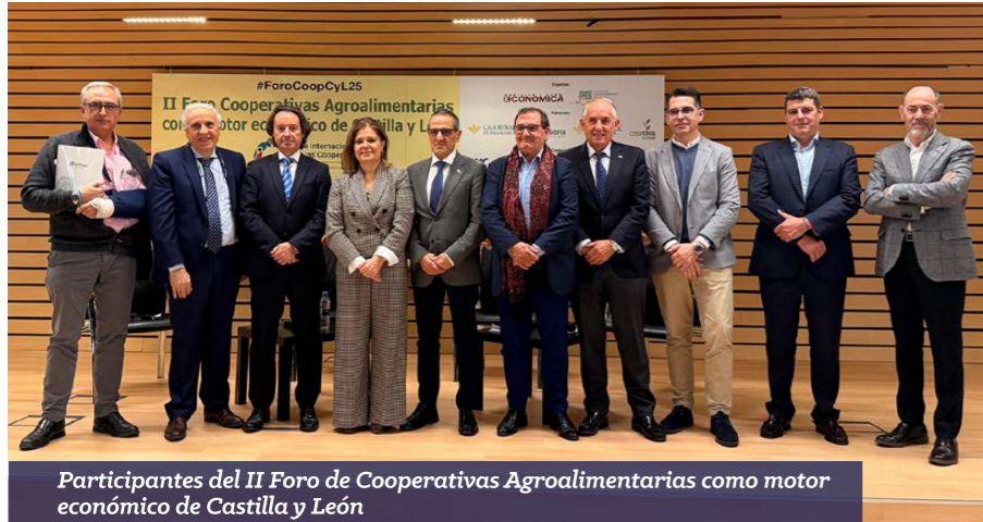
Participantes del II Foro de Cooperativas Agroalimentarias como motor económico de Castilla y León