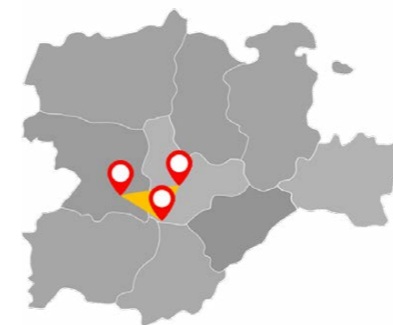
El triángulo entre Tordesillas, Alaejos (Valladolid) y Toro (Zamora)