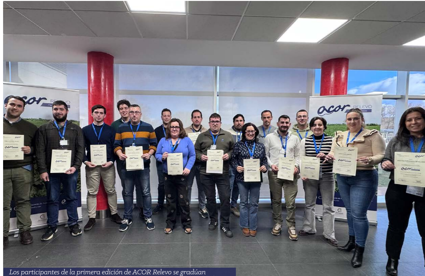
Los participantes de la primera edición de ACOR Relevo se gradúan

La primera edición del programa de formación para mujeres y jóvenes socios concluye con éxito, transformando la percepción de la Cooperativa y consolidando un grupo de nuevos delegados comprometidos con el relevo generacional.