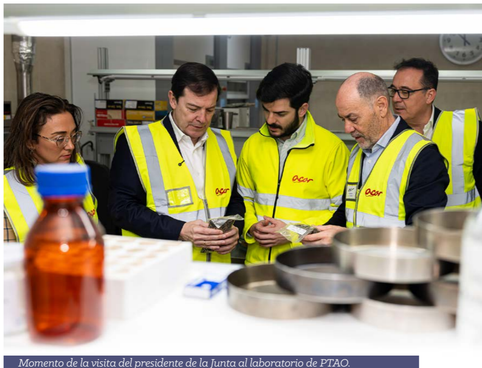
Momento de la visita del presidente de la Junta al laboratorio de PTAO.

El presidente de la Junta y el presidente de ACOR coincidieron en exigir una lógica “reciprocidad” a través de “cláusulas