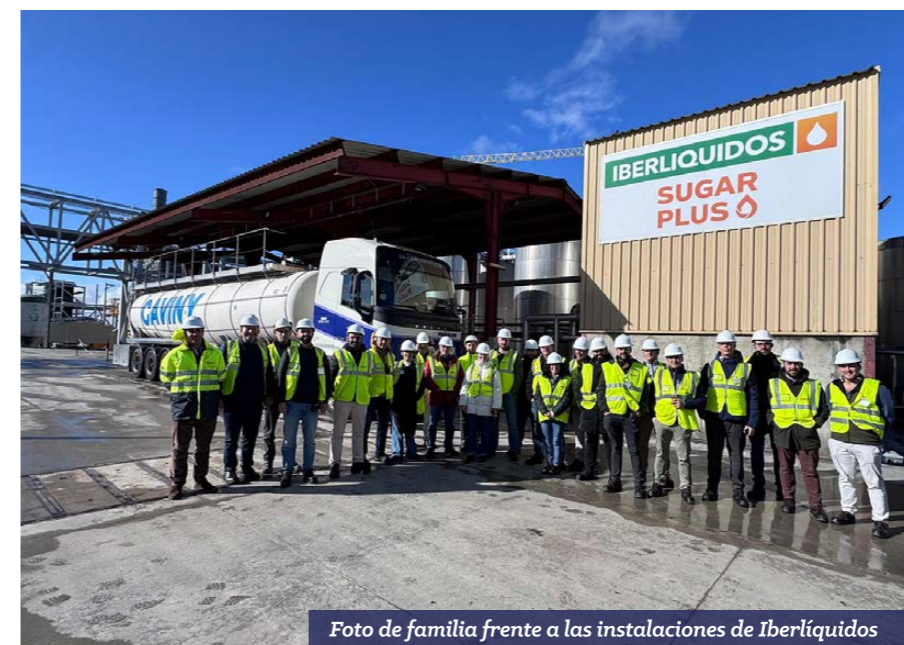
Foto de familia frente a las instalaciones de Iberlíquidos

Aunque Iberlíquidos fue quien organizó la jornada, ACOR estuvo presente en la apertura institucional. La Cooperativa posee el 50 % del capital de Iberlíquidos, mientras que el otro 50 % pertenece a ED&F Man, grupo internacional de referencia en materias primas agrícolas. Esta alianza combina la fortaleza industrial y cooperativa de ACOR con la experiencia global de ED&F Man, posicionando a Iberlíquidos como un actor clave y principal en el suministro de ingredientes líquidos al sector ganadero, que se comercializan bajo la marca Sugar Plus.