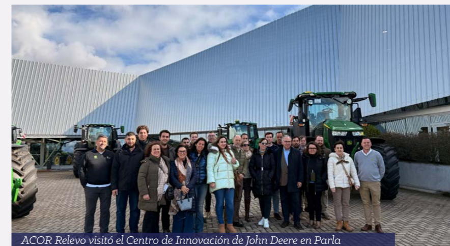
ACOR Relevo visitó el Centro de Innovación de John Deere en Parla

La última sesión del programa no pudo tener un escenario más tecnológico. Los participantes viajaron a Parla para visitar el Centro de Innovación de John Deere, un referente mundial en agricultura de precisión.