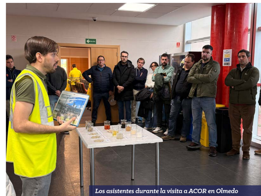
Los asistentes durante la visita a ACOR en Olmedo