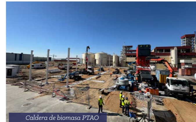
Caldera de biomasa PTAO