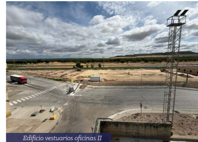
Edificio vestuarios oficinas II