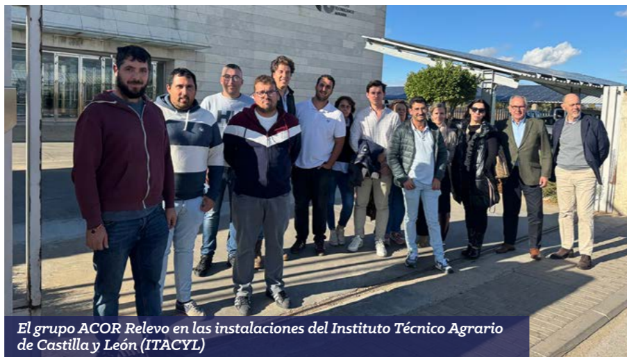
El grupo ACOR Relevo en las instalaciones del Instituto Técnico Agrario de Castilla y León (ITACYL)

Durante la jornada, exploraron soluciones tecnológicas orientadas a la agricultura de precisión, el uso de sensores, sistemas de riego inteligente y plataformas digitales que facilitan la toma de decisiones en las explotaciones. Con ello, pudieron descubrir cómo la digitalización y la investigación aplicada son claves para lograr una agricultura más eficiente, sostenible y competitiva, en línea con los objetivos estratégicos de ACOR.