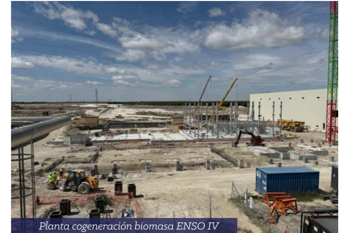
Planta cogeneración biomasa ENSO IV