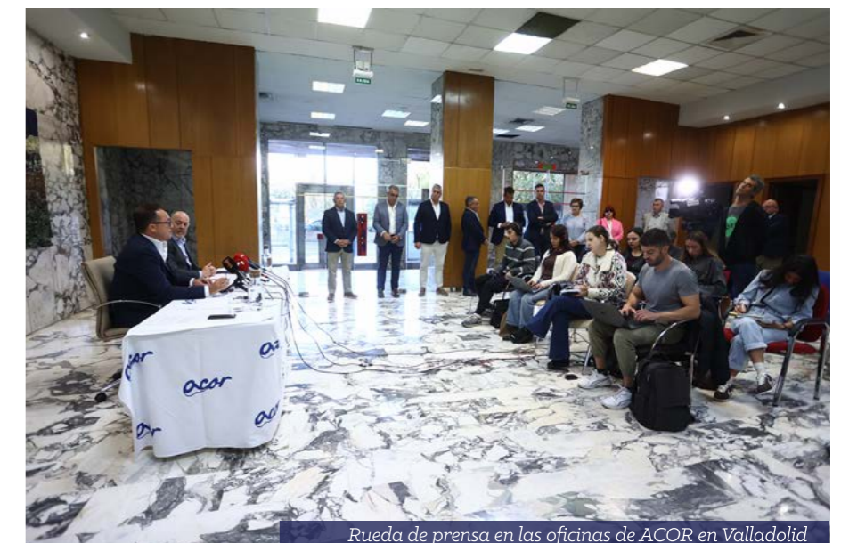
Rueda de prensa en las oficinas de ACOR en Valladolid

cios de ACOR. La pipa de girasol (calidad 9-2-44) se liquidó a 471 €/t para clásico (439 €/t en 2023/24), un 7% más; 513 €/t para alto oleico (446 €/t en 2023/24), un 15% más; mientras que para la semilla de colza (calidad 9-2-42), el precio definitivo alcanzó los 455,5 €/t (436 €/t en