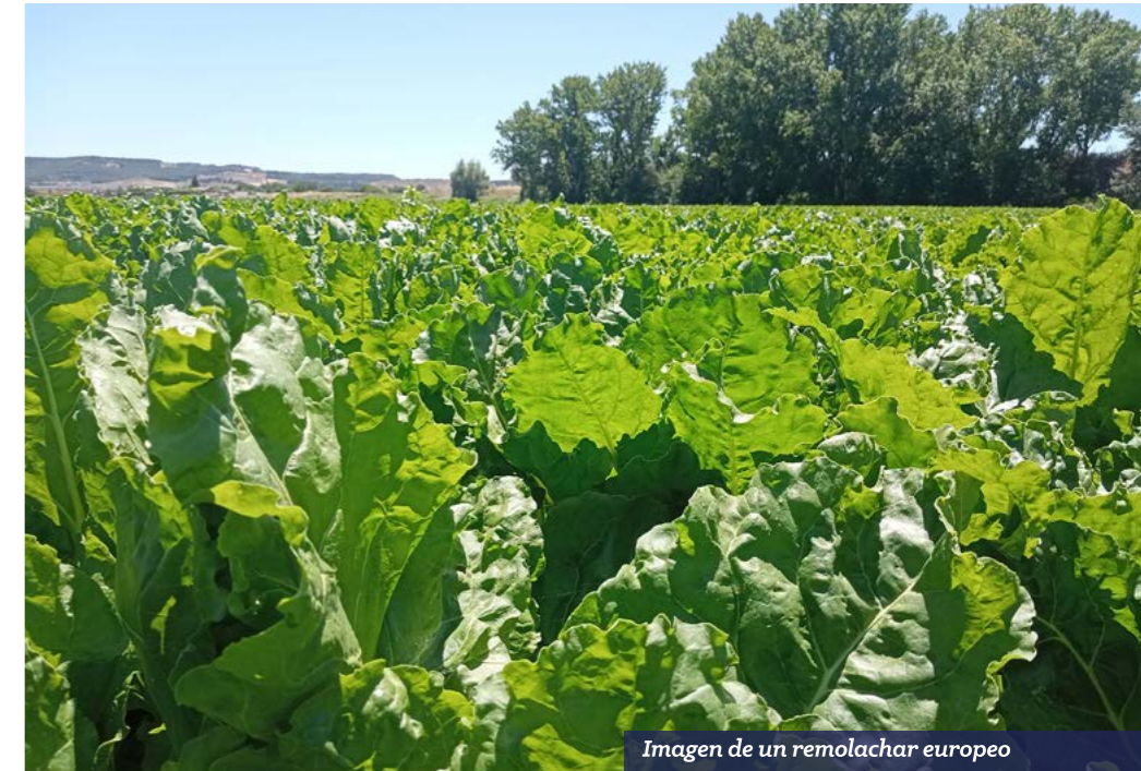
Imagen de un remolachar europeo

El nuevo acuerdo de asociación con Ucrania, que debía haber entrado en vigor el 1 de junio de 2025 tras la expiración del anterior, ha sufrido varios retrasos en su votación por las diferencias entre los Estados miembros. Aunque una mayoría respalda la propuesta revisada, que mantiene un contingente de 100.000 toneladas anuales, países como Eslovaquia, Hungría, Bulgaria, Rumanía, Polonia, Croacia y Grecia han reclamado un fondo de compensación. La Comisión Europea ha rechazado estas peticiones y la presidencia danesa espera cerrar el proceso en noviembre, lo que permitirá aplicar el nuevo sistema de contingentes