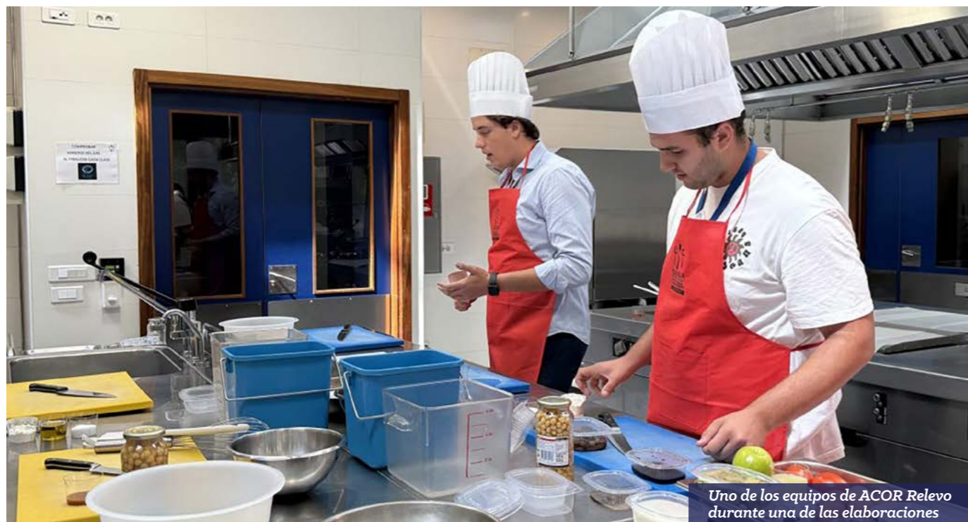
Uno de los equipos de ACOR Relevo durante una de las elaboraciones

El programa ACOR Relevo sigue avanzando con paso firme, consolidándose como una opción formativa única para impulsar el relevo generacional y el liderazgo entre jóvenes y mujeres del sector. En las últimas semanas, los participantes han vivido dos intensas jornadas que combinan conocimiento, innovación y valores cooperativos.