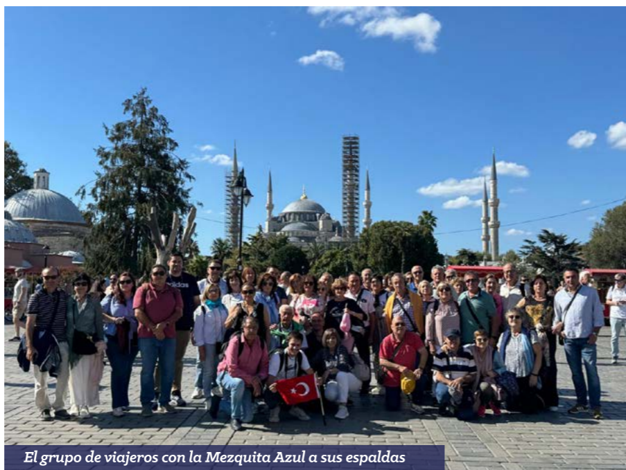
El grupo de viajeros con la Mezquita Azul a sus espaldas

Una estancia de ensueño en la que, además, acompañó el buen tiempo y se pudieron desarrollar todas las actividades previstas.