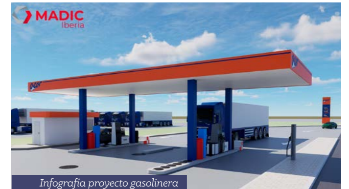
Infografía proyecto gasolinera

ACOR está ejecutando actualmente varias obras en sus instalaciones de Olmedo, cuatro de los proyectos de inversión aprobados por la Asamblea General de Delegados de 2024, más la planta de cogeneración de biomasa de ENSO. Te contamos un poco más sobre estos impresionantes proyectos: