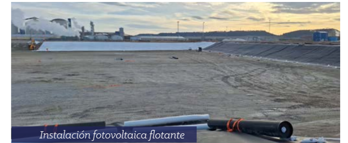
Instalación fotovoltaica flotante