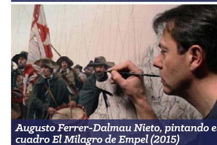
Augusto Ferrer-Dalmau Nieto, pintando el cuadro El Milagro de Empel (2015)

batallas. Su obra le ha valido numerosas distinciones y reconocimientos, entre ellos la Orden de Isabel la Católica, la Gran Cruz al Mérito Militar o la Medalla de Oro al Mérito en las Bellas Artes.