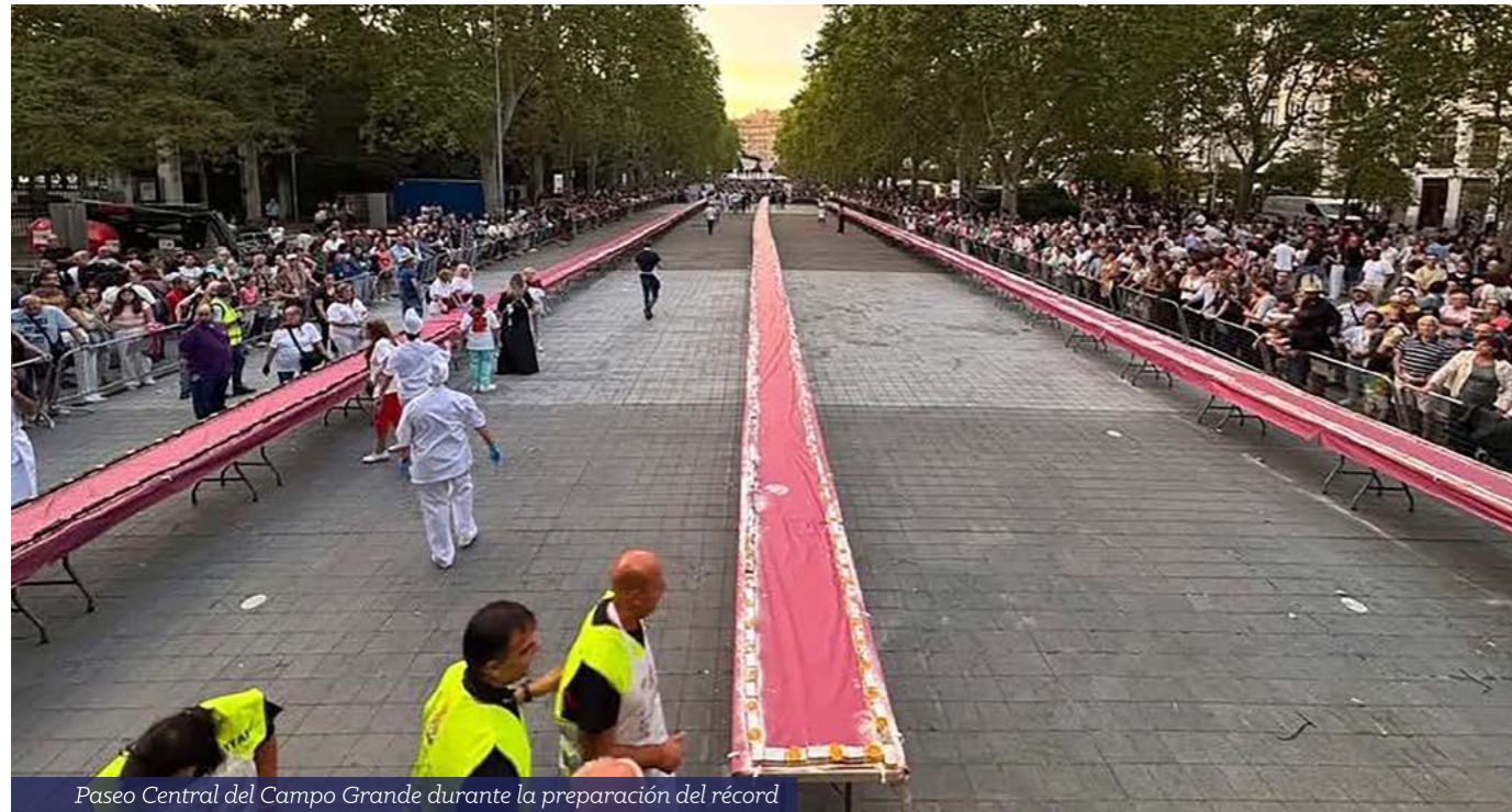
Paseo Central del Campo Grande durante la preparación del récord

El pasado 7 de septiembre, Valladolid se convirtió en escenario de un nuevo récord mundial al elaborar la línea de tartas más larga jamás realizada, con nada menos que 360 metros de longitud de la tarta dedicada a la Virgen de San Lorenzo y más de 4.500 raciones repartidas entre vecinos y visitantes.