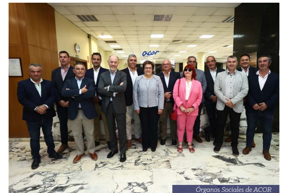
Órganos Sociales de ACOR

La gestión del agua y el relevo generacional centran el II Plan de Estratégico aprobado por el Consejo Rector y que tendrá una vigencia de tres años (2025-27). La Cooperativa reforzará los obje-