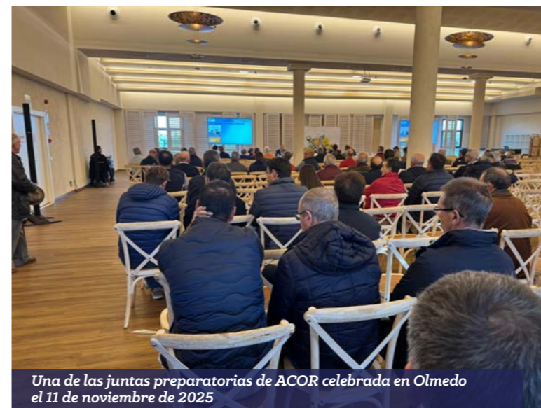
Una de las juntas preparatorias de ACOR celebrada en Olmedo el 11 de noviembre de 2025

Los socios de ACOR han vuelto a darse cita en las reuniones organizadas por zonas territoriales, denominadas juntas preparatorias para analizar el ejercicio 2024-25 y elegir a sus delegados, que serán los encargados de aprobar las cuentas de resultados en la Asamblea General Ordinaria de Delegados el próximo 2 de diciembre de 2025 a las 12.00 horas.