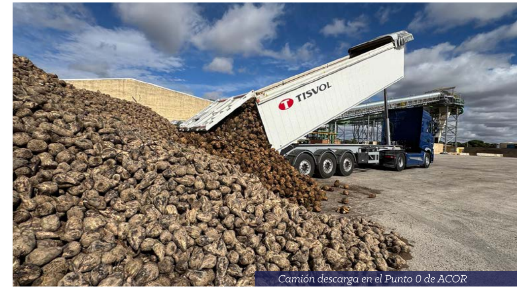
Camión descarga en el Punto 0 de ACOR

A pesar de ese inicio complicado, el mes de julio fue moderado en temperaturas,